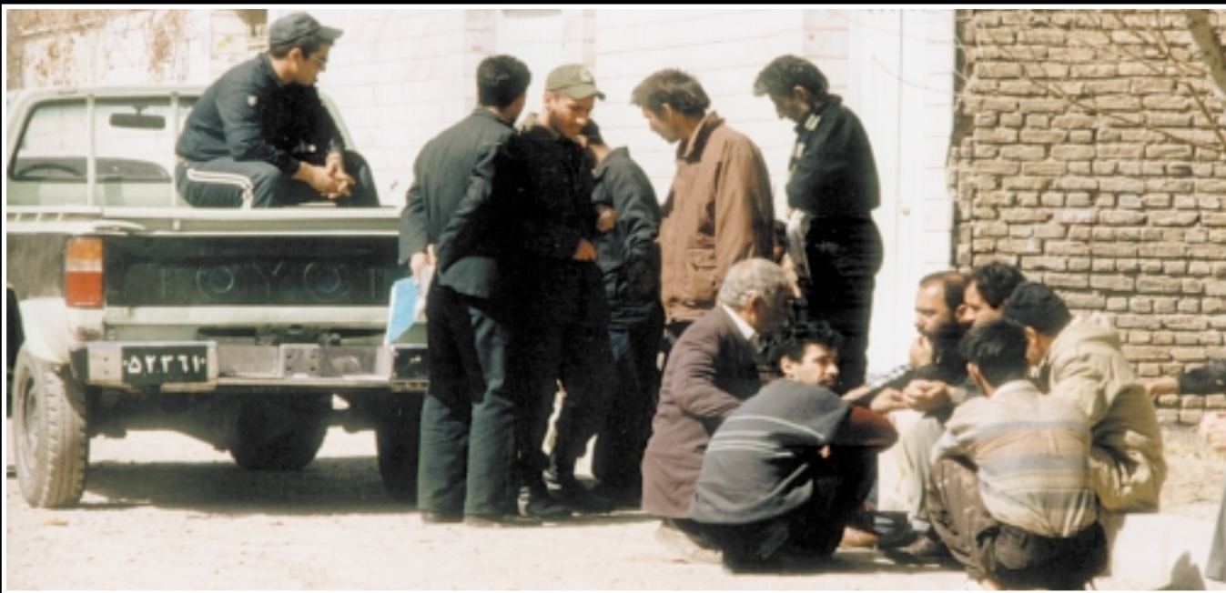
▼ محل نگهداری متهمان در پارک روبروی مجتمع، حتماً برای همسایگان هم خالی از لطف نیست!

مجتمع شهید محلاتی در گوشه‌ای از جنوب تهران همیشه انبوه مراجعان را در بر می‌گیرد، عده‌ای پناه آورده و گروهی به پاسخ فرا خوانده شده‌اند. حکایت این‌ها گاه آنچنان است که روایت‌های متعددی می‌طلبد. آنچه عکاس مجله به گزارش آن پرداخته فقط بخش اندکی از زندگی روزانه است که جای تأمل بسیار دارد.