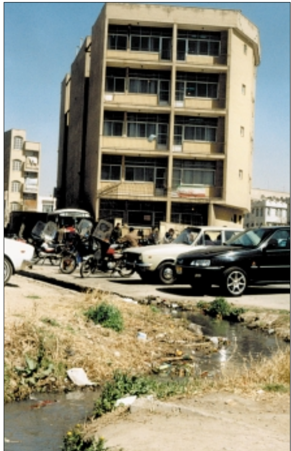
▲ شاید شهرداری های مناطق ۱۴ و ۱۵ نیز مثل ما از زیبا سازی محل راضی نباشند

وی اکنون در مجتمع محلاتی همراه با «۲۵» قاضی، «۱۶» رئیس شعبه، «۲» معاون، «۳» دادرس، «۳» قاضی تحقیق، «۱» مشاور و «۱۶۰» کارمند به انجام وظیفه مشغول است. آنچه کار این عده از کارکنان دادگستری تهران را که در مجتمع محلاتی گرد آمده اند، دشوار می کند بافت منطقه ای است که مجتمع محلاتی در آن واقع شده است. مناطق ۱۴ و ۱۵ شهرداری که تحت پوشش مجتمع شهید محلاتی است، در زمره پرجمعیت ترین مناطق