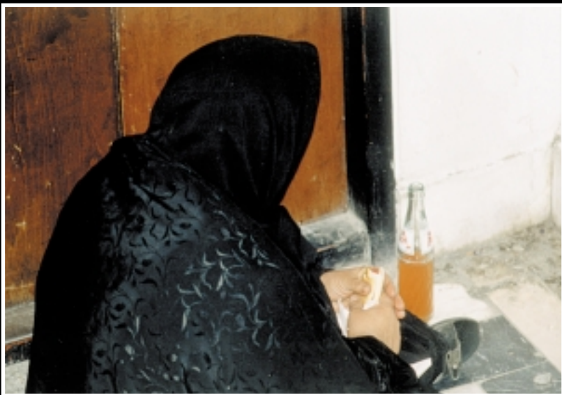
پاگرد طبقات، محل استراحت مراجعه کنندگان ▲